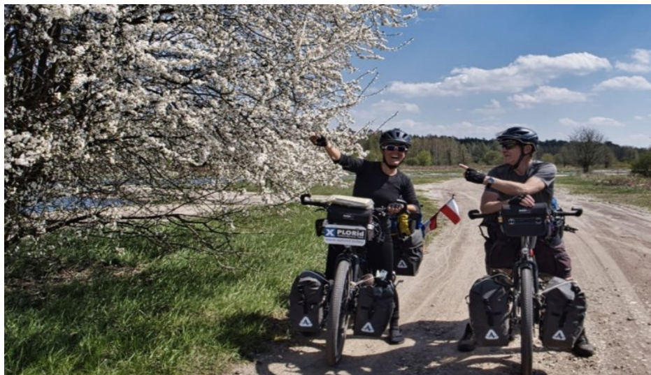
'Over zestig kilometer linksaf, maar we laten ons niet kisten.'

27-06-2021 om 14:26 door Joos Philippens