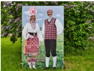
Toeristische fotoshoot.

Zo hebben ze veel ontmoetingen. Overdag bij supermarkten, want ze vallen natuurlijk op met hun 'gewichtige' fietsen, en ze worden aangesproken door andere lange-afstandsfietzers. Of de Poolse Sylwia, inwoner van Athene, die hen in contact brengt met een lokale Poolse krant. Met haar hebben ze nog steeds contact.